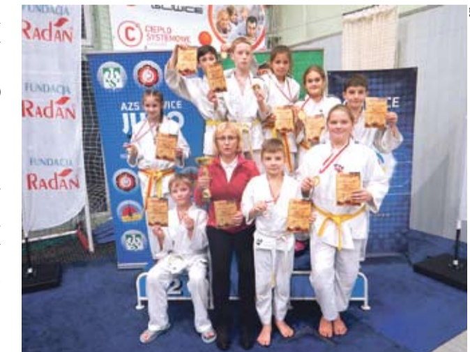
Z mikołajkowego turnieju judo tyszanie przywieźli 10 medali.

W klasyfikacji drużynowej UKS Ippon zajął trzecie miejsce. LS